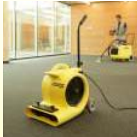
15% 地面维护的服务商