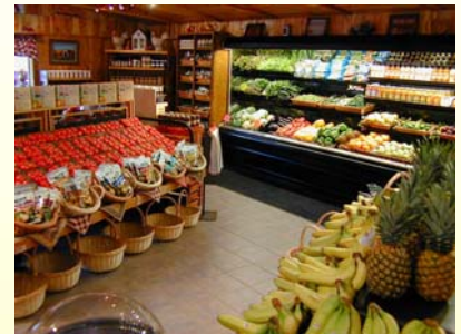
具备“三维一体”先进清洁体系的农贸市场