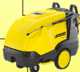
HDS 7/12-4 M