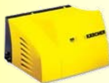
HD 9/16-4 ST-H 固定式冷水高压清洗机，单枪清洁。