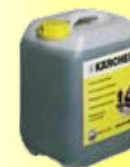
RM 81 通用清洁剂， 提高清洁效率，可大大减少污水排放量。