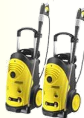
HD 6/16 – 4 M / HD 7/18 – 4 M 清洁游艺玩具，持续喷射，高效的清洁效果，可以完全清洁顽固污垢。